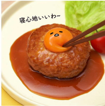
「つくねバーグ寝心地いいわ～」

「ぐでぐでとろける～チーズインぐでたまつくねバーグ」のレシピ動画は、「つくねバーグ寝心地いいわ～」の声とともに、割れたぐでたま(生たまご)がソースと絡み、つくねバーグの中のチーズがとろーりとろける「シズル感」満載のシーンから始まります。