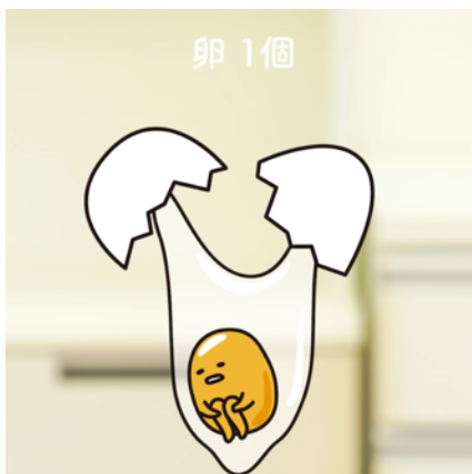
ボウルの上で割られたぐでたま

ひき肉入りのボウルの上でたまごを割ると、ぐでたまが現れ、ひき肉にダイブ。途中しよゆに気を取られたり、お預けを喰らったりしますが、「案外、大事な役割なんだわ～」とたまごの価値を語りながら、ひき肉と混ぜられていきます。チーズを包んで、フライパンへ。フタをあけると、つくねバーグにもぐでたまの顔が現れ「そろそろ、食べごろなんだわ～」の声が。火の通ったぐでたまつくねバーグはお皿に盛り付けられ、最後はぐで生たまごとしてトッピングされ完成です。