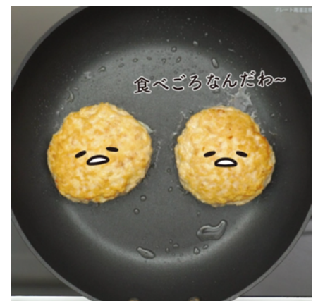
つくねバーグにも現れるぐでたまの顔