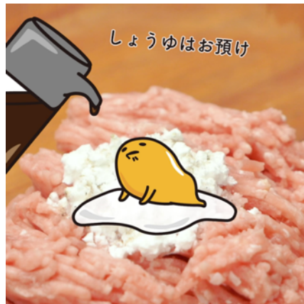
大好物のしょうゆはお預け