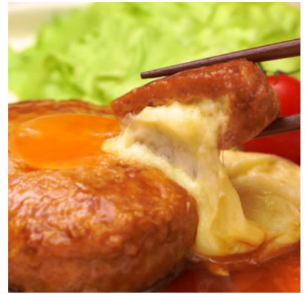
つくねバーグの中からとろーりとろけるチーズ

ひき肉入りのボウルの上でたまごを割ると、ぐでたまが現れ、ひき肉にダイブ。途中しよゆに気を取られたり、お預けを喰らったりしますが、「案外、大事な役割なんだわ～」とたまごの価値を語りながら、ひき肉と混ぜられていきます。チーズを包んで、フライパンへ。フタをあけると、つくねバーグにもぐでたまの顔が現れ「そろそろ、食べごろなんだわ～」の声が。火の通ったぐでたまつくねバーグはお皿に盛り付けられ、最後はぐで生たまごとしてトッピングされ完成です。