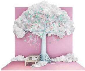
お願いごとツリーブース