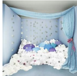
雲のベッドブース