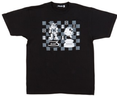
ガンダムvsハローキティ Tシャツ(M・L) 各3,456円(税込)