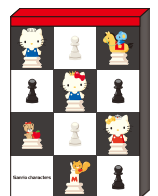
ハローキティ メモ(全2種) 各540円(税込)