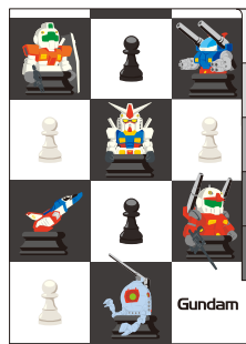
ガンダム 5ポケットクリアファイル (全2種) 各648円(税込)