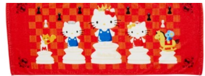
ガンダム・ハローキティ フェイスタオル 各1,944円(税込)