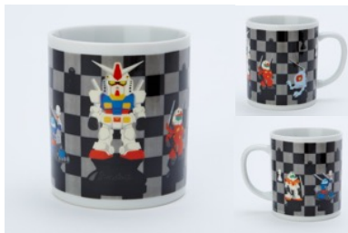
ガンダム マグカップ 1,620円(税込)