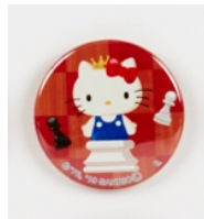
ハローキティ シークレットパッケージ仕様 缶バッジ(全10種) 各432円(税込)