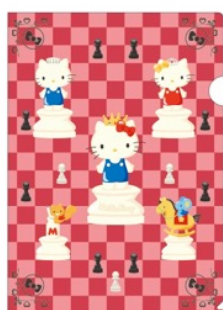
ハローキティ A4クリアファイル (全2種) 各432円(税込)