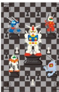
ガンダム A4クリアファイル (全2種) 各432円(税込)