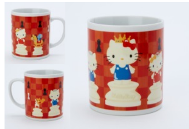
ハローキティ マグカップ 1,620円(税込)