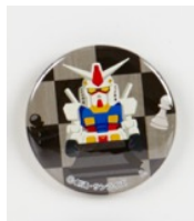
ガンダム シークレットパッケージ仕様 缶バッジ(全10種) 各432円(税込)