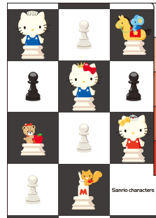
ハローキティ 5ポケットクリアファイル (全2種) 各648円(税込)