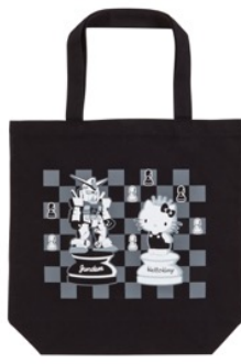
ガンダムvsハローキティ トートバッグ 2,484円(税込)