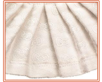
コート内側のプリント