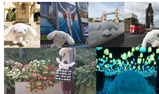
投稿写真例イメージ

今回の「#つれてってシナモン 2019」は、シナモングッズを持っている人も、持っていない人も楽しめるキャンペーンです。一緒にお出かけしたくなる商品を数多く展開するほか、シナモンと一緒に一緒にお出かけできるおすすめスポットにてスタンプラリーも開催いたします。また、シナモングッズを持っていない人や、一緒にお出かけするのを忘れてしまった人も、キャンペーン専用写真アプリや、カメラアプリ「BeautyPlus」のキャンペーンオリジナルデザイン AR フィルターでデコレーションした写真でのキャンペーンへの参加も受け付けています。