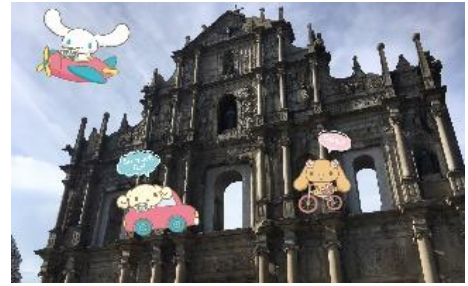
写真デコレーション例イメージ