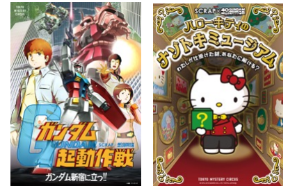
第3ステージ SCRAP 謎解きキービジュアル

★第3ステージ (SCRAP 謎解きイベントクリア者数対決) ガンダム 2,414人-ハローキティ 3,383人 ハローキティ勝利！！ 対決は終了しましたが謎解きは2019年12月末まで 東京ミステリーサーカス(歌舞伎町)にて 好評開催中！！