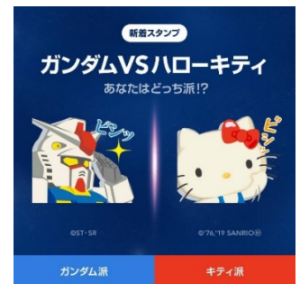
第8ステージ LINEスタンプ

★第8ステージ (LINEスタンプランキング対決) ガンダム勝利！！ 対決は終了しましたがスタンプは好評発売中！！