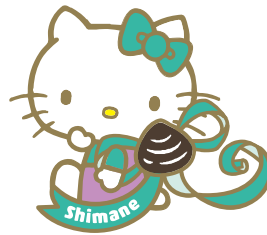
島根 ハローキティ