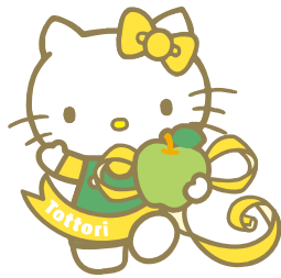
鳥取 ハローキティ