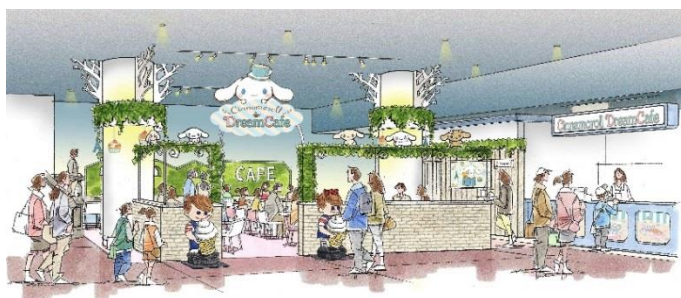
シナモロールドリームカフェイメージ