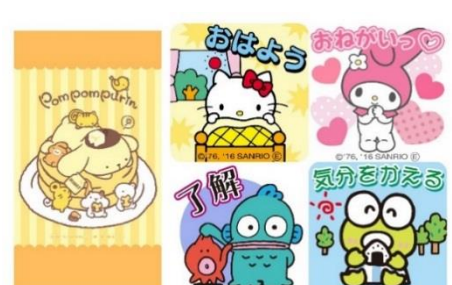
デジタルコンテンツ画像例

※デジタルコンテンツは壁紙やメッセージアプリなどで利用できるデコメ絵文字など、100種類以上。