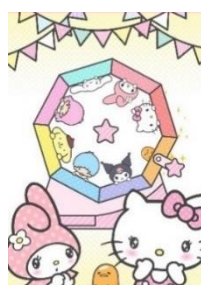
バーチャルガラポン画面