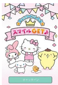
スマイルゲット画面 (チェックイン時)

URL： https://www.sanrio.co.jp/news/sanriopassport-20170425/