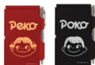
ペコちゃん、ポコちゃんフリップノート