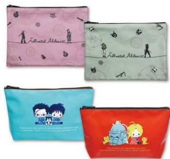
ポーチ 全8種 メーカー希望小売価格 各1,400円(税抜) 発売元: 株式会社トーションパック