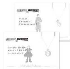
5108/コトバ ネックレス 全2種 メーカー希望小売価格 各3,800円(税抜) 発売元: 株式会社マリモクラフト