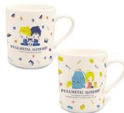
マグカップ 全2種 メーカー希望小売価格 各1,200円(税抜) 発売元: 株式会社マリモクラフト