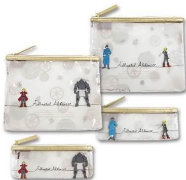
2連ポーチ 全2種(エルリック兄弟、エド&ロイ) メーカー希望小売価格 各1,800円(税抜) 発売元: 松尾繊維工業株式会社