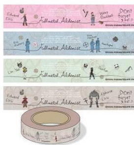
マスキングテープ 全4種 メーカー希望小売価格 各400円(税抜) 発売元: 株式会社読売テレビエンタープライズ