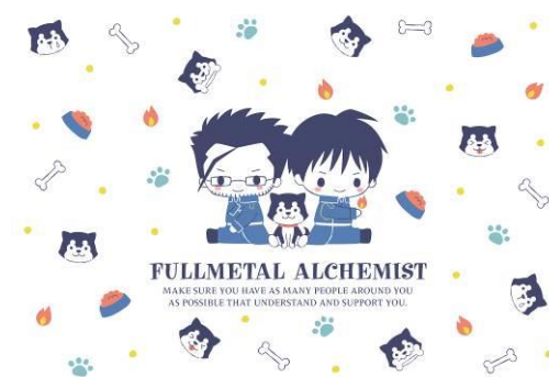
マスタング&ヒューズ&ブラックハヤテ号