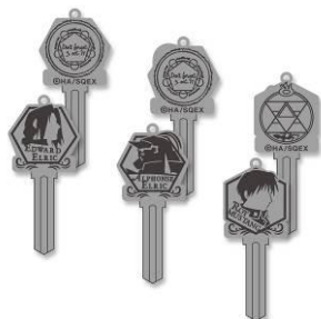
きゃらかギ! 全3種 メーカー希望小売価格 各1,200円(税抜) 発売元: 株式会社マリモクラフト