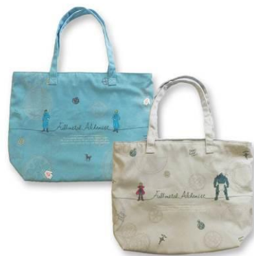
ビッグトートバッグ 全2種 メーカー希望小売価格 各3,500円(税抜) 発売元: 株式会社KThingS