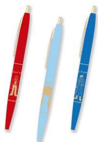
BIC ボールペン(クリックゴールド) 全3種 メーカー希望小売価格 各400円(税抜) 発売元: 株式会社マリモクラフト