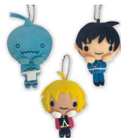
びよこのるボールチェーン 全3種 メーカー希望小売価格 各1,300円(税抜) 発売元: 株式会社読売テレビエンタープライズ