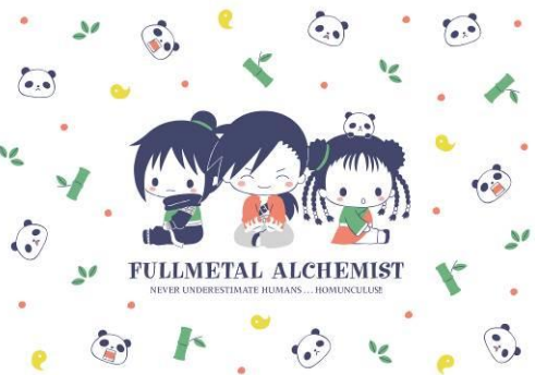
ランファン&リン&メイ&シャオメイ