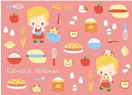
だいすきアップルパイ柄