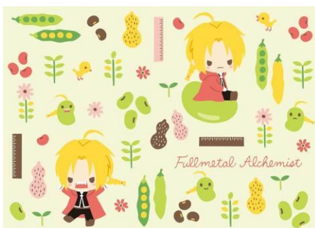
まめつぶドチビ柄

・「押しキャラキュート」…「キュート」デザインを基に、各キャラクターに焦点をあて、それぞれのモチーフ、性格をユニークにデザイン表現いたしました。