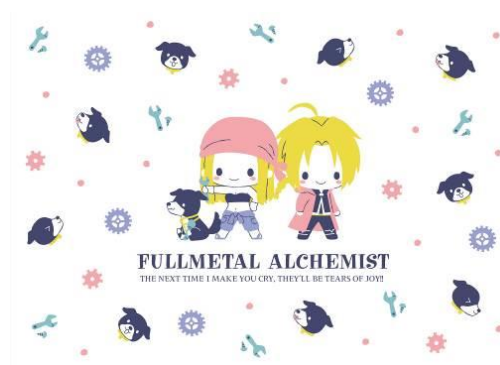
エド&ウィンリイ&デン