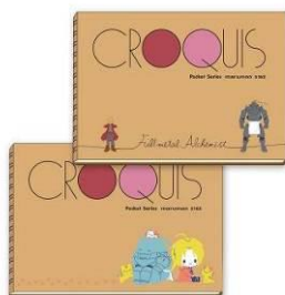
ポケットクロッキー帳 全2種 メーカー希望小売価格 各680円(税抜) 発売元: 株式会社ティーシーピー