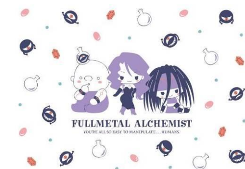
エンヴィー&ラスト&グラトニー

・「押しキャラキュート」…「キュート」デザインを基に、各キャラクターに焦点をあて、それぞれのモチーフ、性格をユニークにデザイン表現いたしました。