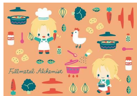
だいすきシチュー柄