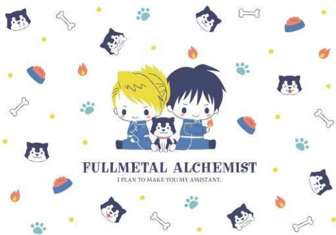
マスタング&ホークアイ&ブラックハヤテ号