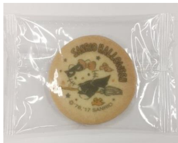
オリジナルデザインクッキー

みんなにも使える魔法の呪文を教えます。カードを渡すから、呪文を練習してまた持ってきてね。