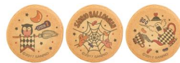
シークレットデザイン一例 (全10種あります)

2. 販売ルート：◇サンリオ直営店・百貨店のサンリオコーナー他（一部取扱いの無い店舗もございます）