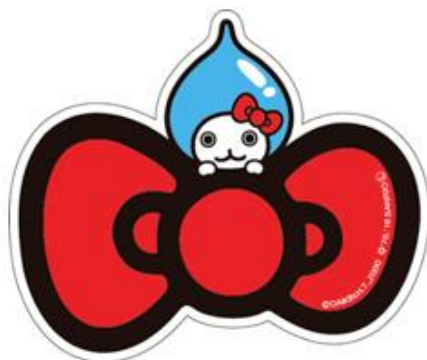
a. リボン形 アクリルステッカー