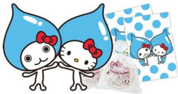
“ぴちよんくん×ハローキティ コラボグッズ”

さらに期間中、対象の空気清浄機を全国の家電量販店※1でご購入頂いた方には、キレイで心地よい空気を作り出す空気清浄機を可愛くデコレーションできる、“ぴちよんくん×ハローキティ限定ステッカー”をプレゼントするキャンペーンも実施いたします。