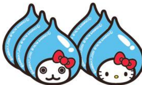
b. ぴちよんくん×ハローキティ ぶっくりステッカー