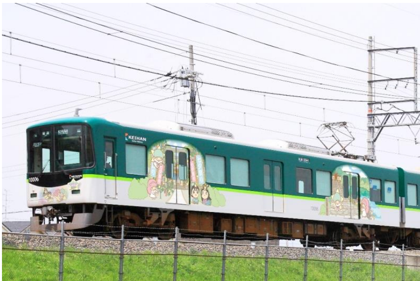
星のまち 枚方・交野 キキ&ララトレイン（イメージ）