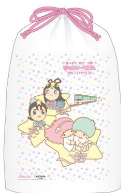
特製オリジナルビニールバッグ