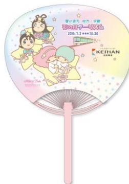
オリジナルうちわ