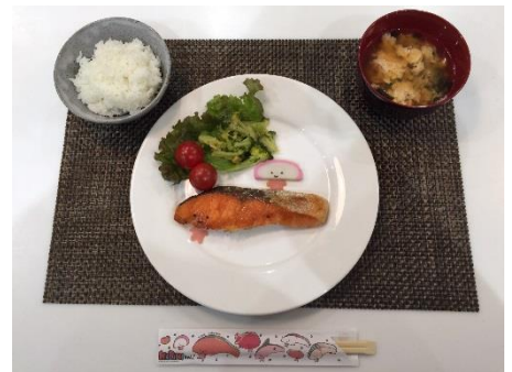
「KIRIMI ちゃん。」メニューイメージ