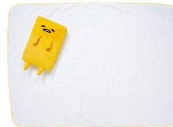
枕を乗せた状態のもの (商品の仕様とは若干異なります)

・ブランケットは身体にかけるのにちょうど良い 約 135W×100D cmサイズ