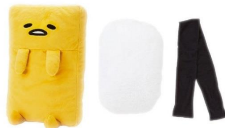
たまご枕 シャリブランケット のりベルト (シャリケースに入れた状態のもの)