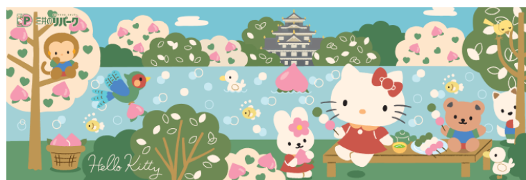
設置パネルイメージ

本社：東京都品川区大崎1丁目11番1号 設立：1960年(昭和35年)8月10日 資本金：10,000百万円 売上高：72,476百万円(2016年3月期、連結) 従業員数：762名(2016年3月31日現在)