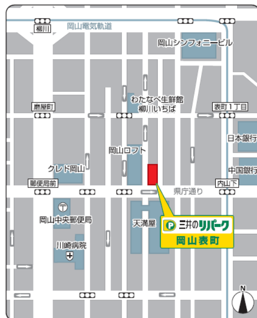
「三井のリパーク」岡山表町駐車場 地図

今後のスケジュール： 大阪、仙台(年内予定) プレゼントキャンペーン： 開始時期未定 ※HPにて順次公開予定 特設ページ URL： http://www.repark.jp/hellokitty/