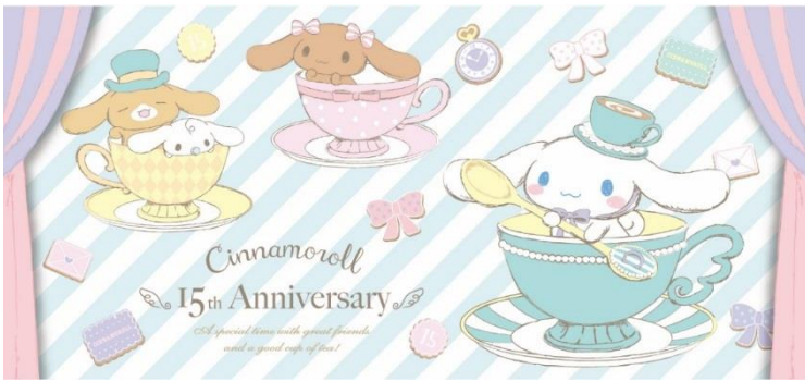
デビュー15周年メインキービジュアルとマーク