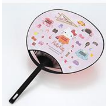
サンリオギャラリー京都 地図