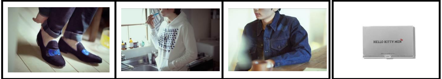
＜アンライン バイ アルフレッド バニスター＞ オペラシューズ ¥30,240(税込)