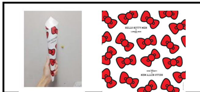
＜クレーブラッピング紙＞ (C)'04,15 SANRIO