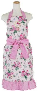
エプロン 3,780 円