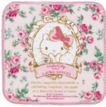
プチタオル 972 円