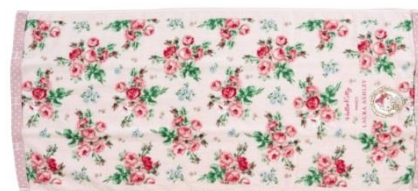
フェイスタオル 2,160円