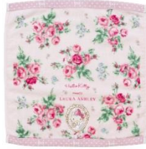
ハンドタオル 1,404 円