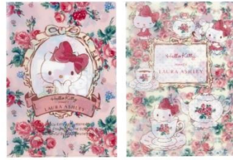
A4 クリアファイル 486 円 2 枚セット