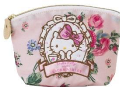
ティッシュポーチ 1,944円