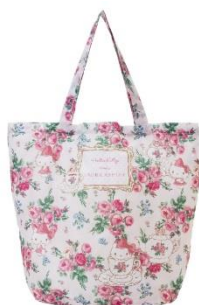
マイバッグ 2,700円 ※ハローキティの顔形ポーチ付