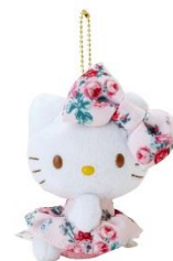
マスコットホルダー 2,160円