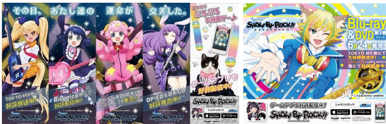
▲アドアーズ秋葉原店 外壁広告 イメージ