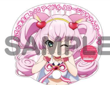
▲限定書き下ろしロージアちゃんうちわイメージ

【概要】対象店舗4店舗にて、クリティクリスタ“ロージア”の限定書き下ろしデザインのうちわをご希望の方に数量限定でプレゼント！ ※うちわはなくなり次第終了とさせていただきます。