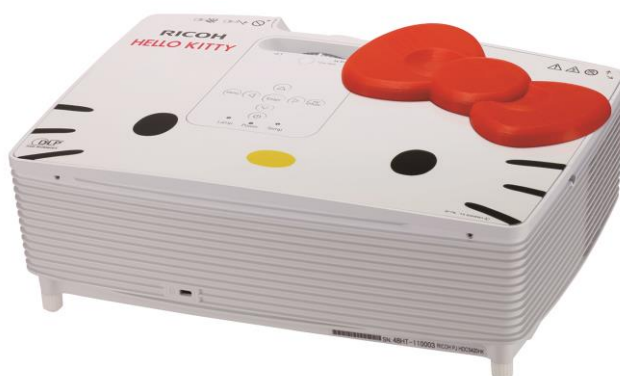
RICOH PJ HDC5420HK