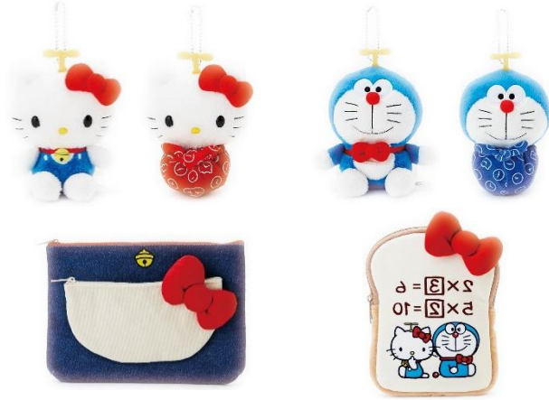
上：マスコットホルダー ひっくり返す前と後 下左：フラットポーチ 右：ペンポーチ