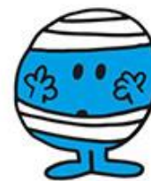
ミスター・パンプ (ドジドジくん) いつもどこかにぶつかって怪我ばかり しているドジな男の子