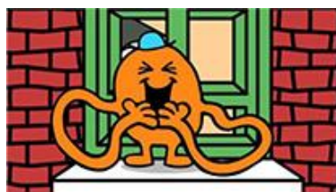
Mr. Tickle/ミスター・ティックル (コチョコチョコくん)