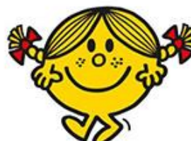
リトルミス・サンシャイン (ニコニコちゃん) 常に笑顔でみんなをニコニコさせる不思議な 魅力を持った女の子