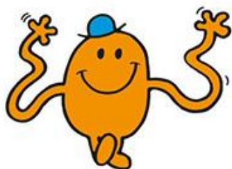
ミスター・ティックル (コチョコチョコくん) 伸びる手でいつもくすぐる相手を探している いたずら好きの男の子