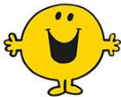
ミスター・ハッピー (ハッピーくん) トレードマークのスマイルでみんな に幸せを運んでくれる陽気な男の子