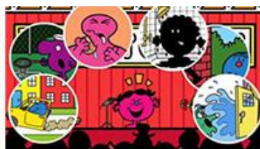
Little Miss Bad/リトルミス・バッド (わるいこちゃん)