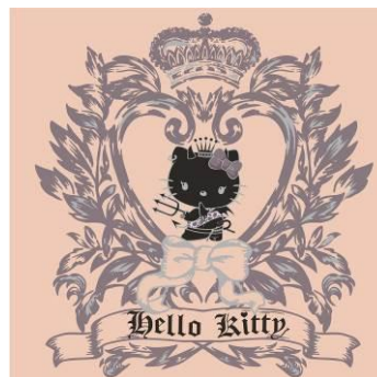
エンブレムデザイン