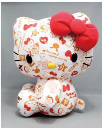
ぬいぐるみ リミテッド Ver.