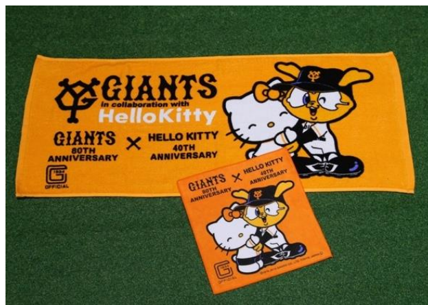
フェイスタオル(上) プチタオル(下)