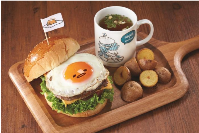
カフェメニュー「ぐでたまバーガー」イメージ

10月6日(月)～11月5日(水)・ヴィレッジヴァンガード ダイナー横浜ルミネ店