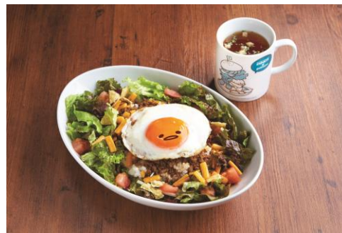
カフェメニュー「ぐでたまタコライス」イメージ