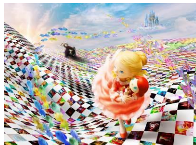
映画「くるみ割り人形」