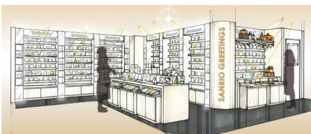
2階グリーティングカードショップ