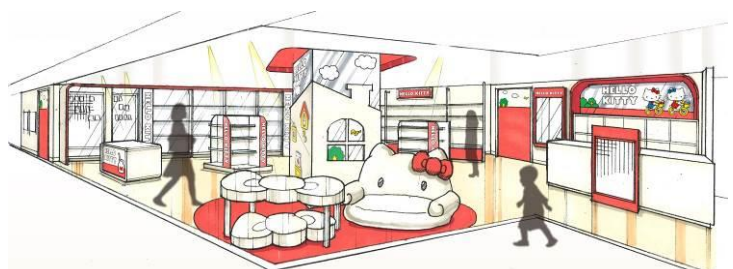
2階ハローキティショップ