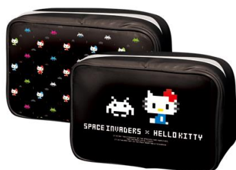
10月登場予定 「スクエアポーチ」

販売用商品以外にも全国のアミューズメント施設のプライズ専用景品として「SPACE INVADERS × HELLO KITTY」が、登場いたします。化粧品や文房具などの小物入れとして活躍する大きめの「スクエアポーチ」と、涼しい時期に嬉しい「ビッグブランケット」の展開を予定しています。